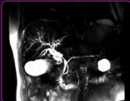
MRT nach LumiVision®